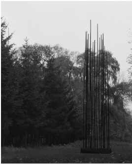
© VG Bild-Kunst, Bonn; Alice Bahra; Christian Roehl

Nachlass: Roehl, Christian [Werkverzeichnis Plastik] Werkverzeichnis-Nr.: 035 Objekttyp: Plastik