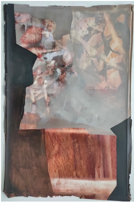
© Hans-Joachim Rose, Daniel Rose, Benjamin Rose Foto: Thomas Kumlehn