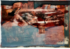
© Hans-Joachim Rose, Daniel Rose, Benjamin Rose Foto: Thomas Kumlehn

unbenannt [Fliegen / Schweben im Raum] Squaw Hildegard Rose, vermutlich 1992 [1992]