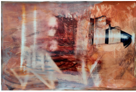
© Hans-Joachim Rose, Daniel Rose, Benjamin Rose Foto: Thomas Kumlehn

unbenannt [Fliegen / Schweben im Raum] Squaw Hildegard Rose, Febr. 1992 [1992]