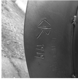
Flammenschale, Detail mit Signatur Mahnmal für die antifaschistischen Widerstandskämpfer 1979 Edelstahl, gebaut 95 (Höhe) x 280 cm (Durchmesser)

© VG Bild-Kunst, Bonn; Alice Bahra; Christian Roehl Foto: Alice Bahra/ Archiv Christian Roehl, Potsdam