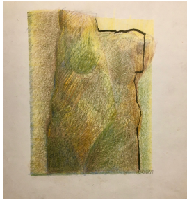
Skizze zum Torso undatiert

© VG Bild-Kunst, Bonn; Yvette Ihlow-Gaedicke, Urs Ihlow Foto: Yvette Ihlow-Gaedicke