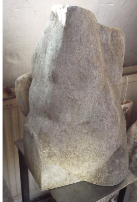
Torso Zugriff 1986 Marmor Höhe 49 cm

© VG Bild-Kunst, Bonn; Yvette Ihlow-Gaedicke, Urs Ihlow Foto: Yvette Ihlow-Gaedicke