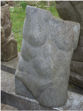
© VG Bild-Kunst, Bonn; Yvette Ihlow-Gaedicke, Urs Ihlow