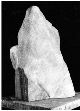
Torso Zugriff 1986 Marmor Höhe 49 cm

© VG Bild-Kunst, Bonn; Yvette Ihlow-Gaedicke, Urs Ihlow