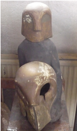
© VG Bild-Kunst, Bonn; Yvette Ihlow-Gaedicke, Urs Ihlow