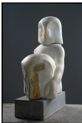
Zeit-Metapher I (Arbeitszustand)