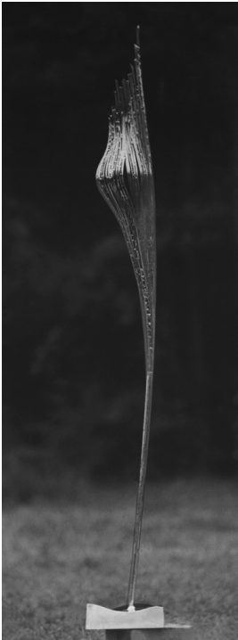
© VG Bild-Kunst, Bonn; Alice Bahra; Christian Roehl Foto: Bernd Gurlt, Potsdam/ Archiv Christian Roehl, Potsdam