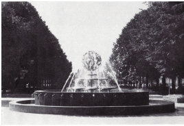
© VG Bild-Kunst, Bonn; Alice Bahra; Christian Roehl/ Manfred Schindler Foto: Archiv Christian Roehl, Potsdam