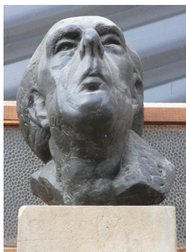
Pfortner Kops vom Pariser Platz 1984 Bronzeguss Höhe 33 cm

© VG Bild-Kunst, Bonn; Yvette Ihlow-Gaedicke, Urs Ihlow