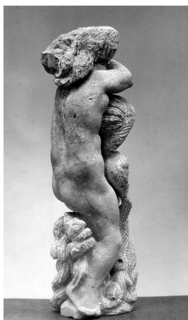
Karyatide 1977 Freyburger Kalkstein Höhe 40 cm

© VG Bild-Kunst, Bonn; Yvette Ihlow-Gaedicke, Urs Ihlow Foto: AdK/Kraushaar