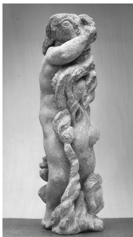
Karyatide 1977 Freyburger Kalkstein Höhe 40 cm

© VG Bild-Kunst, Bonn; Yvette Ihlow-Gaedicke, Urs Ihlow