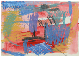
© Jochen Wermann Foto: Thomas Kumlehn