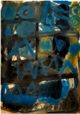
© Jochen Wermann Foto: Thomas Kumlehn