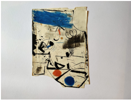
© Jochen Wermann Foto: Thomas Kumlehn