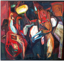
© VG Bild-Kunst, Bonn; Rose und Otto Schack