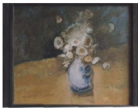
Weiße Strohblumen -Öl- 1977

Zuordnung durch die Künstlerin in einer Arbeitsmappe für Werk 055