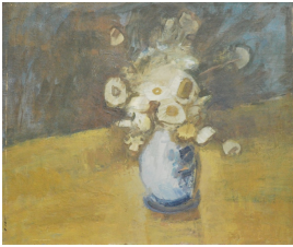
© Jana Zadow-Dorr, Ina Ulrich Foto: Jana Zadow-Dorr