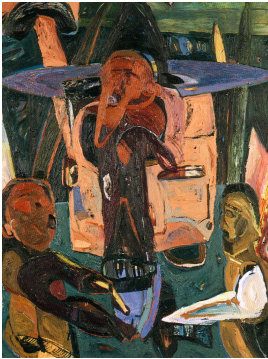
© VG Bild-Kunst, Bonn; Rose und Otto Schack