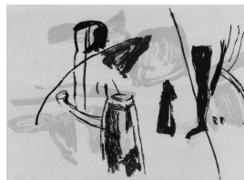
Im großen Gespräch o.J. Farbsiebdruck 45 x 60 cm

© VG Bild-Kunst, Bonn; Rose und Otto Schack Foto: Philipp Schack