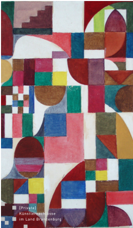
© Robert und Hendrik Robbel Foto: Thomas Kumlehn