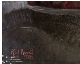
Am Meere (III) Bildausschnitt mit Signatur und Datierung 1981 Öl mit Eitempera auf Hartfaser 61 x 79 cm

© Robert und Hendrik Robbel