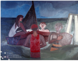
© Robert und Hendrik Robbel Foto: Thomas Kumlehn