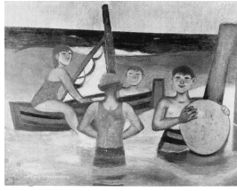
Am Meere II 1972 Öl und Eitempera auf Leinwand auf Hartfaser 61 x 79 cm (Bildvorlage: Kat. K.R. und seine Schüler, Berlin 1982, S. 63)

© Robert und Hendrik Robbel Foto: unbekannt