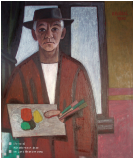
© Robert und Hendrik Robbel Foto: Thomas Kumlehn