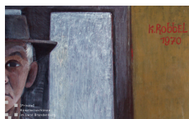
Selbstporträt mit Hut II Bildausschnitt mit Signatur und Datierung 1970 Öl mit Eitempera auf Hartfaser 66 x 55 cm

© Robert und Hendrik Robbel Foto: Thomas Kumlehn