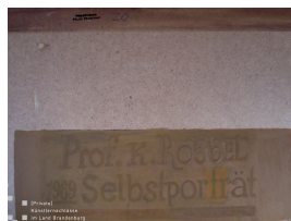
Selbstporträt mit Hut II (verso) 1970

© Robert und Hendrik Robbel