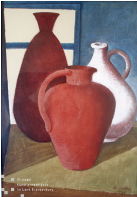
© Robert und Hendrik Robbel Foto: Thomas Kumlehn