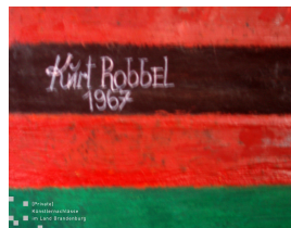
Figuren im Simultankontrast Bildausschnitt mit Signatur und Datierung 1967 Eitempera mit Öl auf Hartfaser 90 x 62 cm

© Robert und Hendrik Robbel Foto: Thomas Kümlehn