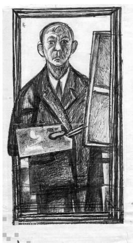
unbenannt [Selbstporträt] undatiert [vermutl. 1969] Kugelschreiber auf Papier 21.5 x 12.5 cm

© Robert und Hendrik Robbel