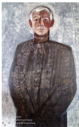
© Robert und Hendrik Robbel Foto: Thomas Kumlehn