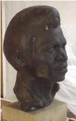
© VG Bild-Kunst, Bonn; Yvette Ihlow-Gaedicke, Urs Ihlow