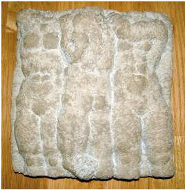
© VG Bild-Kunst, Bonn; Sylvia Hagen Foto: privat