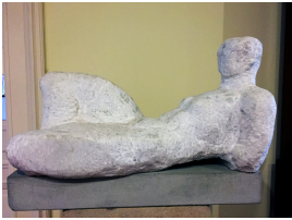
© VG Bild-Kunst, Bonn; Sylvia Hagen Foto: Barb Kirkamm