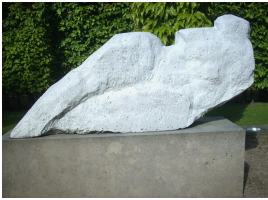
© VG Bild-Kunst, Bonn; Sylvia Hagen