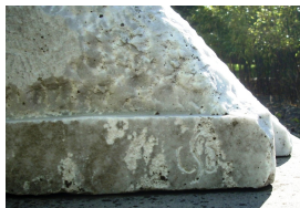
Die Flut (verso) Detail Signatur: WS 1997 und 2000

© VG Bild-Kunst, Bonn; Sylvia Hagen