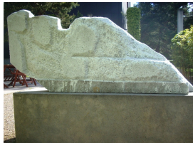
Die Flut (verso) 1997 und 2000 Marmor 65 x 140 x 30 cm

© VG Bild-Kunst, Bonn; Sylvia Hagen