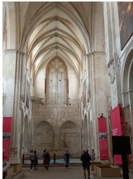
Inneres der Klosterkirche Leubus Zustand im Jahr 2023