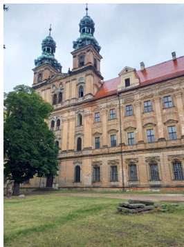
Außenansicht des Zisterzienerklosters Leubus mit Kirchenfront Zustand im Jahr 2023