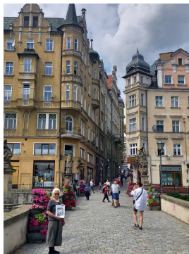
Aktuelle Ansicht des Gemäldemotivs im Jahr 2023