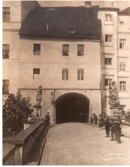
Altes Brückentor in Glatz Fotografie um 1886