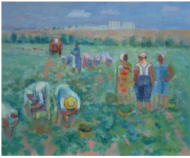
© Jana Zadow-Dorr, Ina Ulrich Foto: Jana Zadow-Dorr