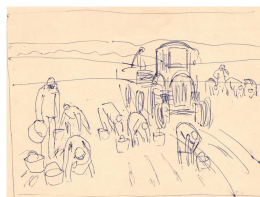
Studie zu "Gurkenerte" undatiert [1974-77]

© Jana Zadow-Dorr, Ina Ulrich Foto: Jana Zadow-Dorr