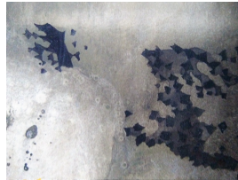
unbenannt, Detail Mitte