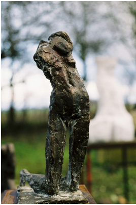
© VG Bild-Kunst, Bonn; Sylvia Hagen