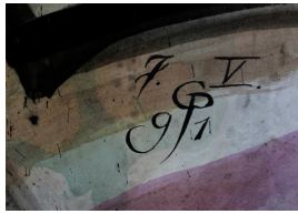
recto [Signatur] Instinkt der Herde 07.05.1991 Farbige Tusche auf Papier 75,8 x 95 cm