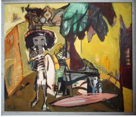
© VG Bild-Kunst, Bonn; Rose und Otto Schack