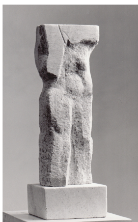
Trauer muss Elektra tragen (Zustand)