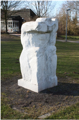
© VG Bild-Kunst, Bonn; Sylvia Hagen

Nachlass: Stötzer, Werner [Werkverzeichnis Skulptur und Plastik] Werkverzeichnis-Nr.: 237 Objekttyp: Skulptur Entstehungsort: Syke