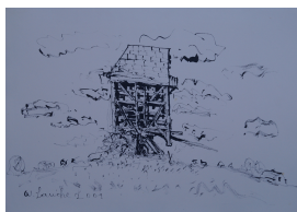
Walter Lauche, Mühle in Langerwisch, 2001, Tusche auf Bütten, 50 x 70 cm

© Magdalena Lauche; Archiv Walter Lauche Foto: Walter Lauche