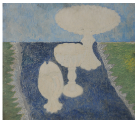
Walter Lauche Stillleben, undatiert [1966/67] Mischtechnik auf Hartfaser 55,5 x 60 cm Hochschule für Bildende Künste Dresden, Inventarnummer A 737

© Magdalena Lauche Foto: Hochschularchiv