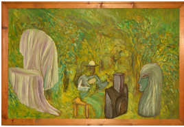
© Magdalena Lauche Foto: Cosima Hankel