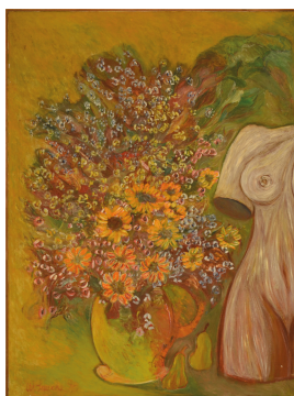
Walter Lauche Blumenstrauß mit Torso, 1995 Privatbesitz

© Magdalena Lauche; Karl Späth Foto: Thomas Kumlehn