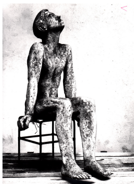
Sitzender Junge, Entwurf