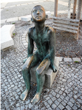
© VG Bild-Kunst, Bonn; Sylvia Hagen Foto: Astrid Volpert