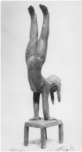
© VG Bild-Kunst, Bonn; Sylvia Hagen Foto: Akademie der Künste, Berlin