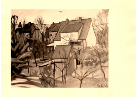
© VG Bild-Kunst, Bonn; Dr. Sigmar Uhlig Foto: unbekannt