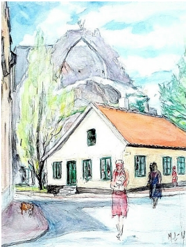
© VG Bild-Kunst, Bonn; Dr. Sigmar Uhlig