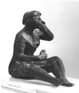
© VG Bild-Kunst, Bonn; Sylvia Hagen