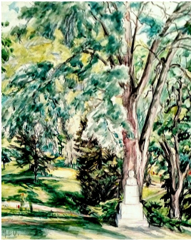
© VG Bild-Kunst, Bonn; Dr. Sigmar Uhlig