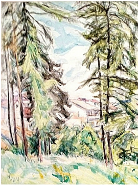
© VG Bild-Kunst, Bonn; Dr. Sigmar Uhlig