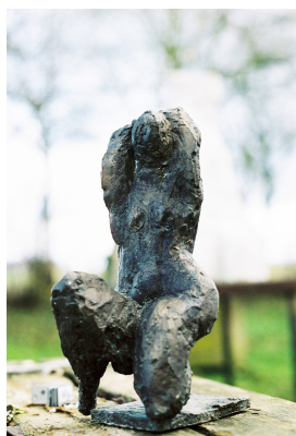
© VG Bild-Kunst, Bonn; Sylvia Hagen