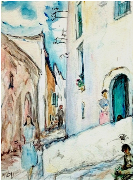
© VG Bild-Kunst, Bonn; Dr. Sigmar Uhlig