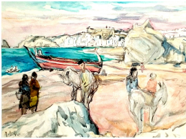
© VG Bild-Kunst, Bonn; Dr. Sigmar Uhlig