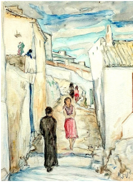
© VG Bild-Kunst, Bonn; Dr. Sigmar Uhlig Foto: Siegfried Jahn