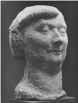
© VG Bild-Kunst, Bonn; Sylvia Hagen

Nachlass: Stötzer, Werner [Werkverzeichnis Skulptur und Plastik] Werkverzeichnis-Nr.: 007 Objekttyp: Skulptur Alternative Titel: Porträtstudie (Alte Frau) Entstehungsort: Meisterschüleratelier, Deutsche Akademie der Künste, Berlin